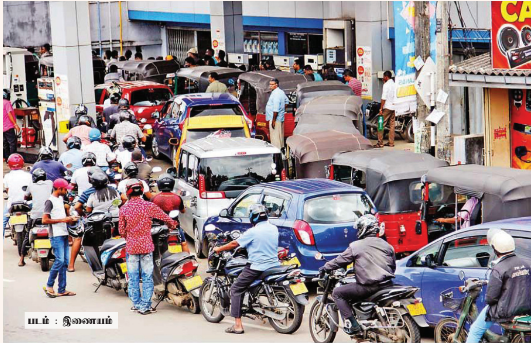
படம் : இணையம்

மத்திய கிழக்கு நாடுகளுக்கான தேயிலை ஏற்றுமதி பாதிக்கப்பட்டுள்ளதால், இலங்கைக்கு மாதம் சுமார் 50 மில்லியன் அமெரிக்க டொலர் வருமான இழப்பு ஏற்படும் அபாயம் ஏற்பட்டுள்ளது.