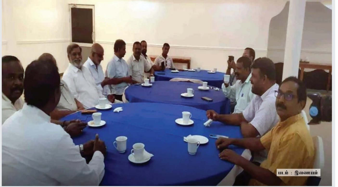
படம் : இலங்கை

வரலாற்று ரீதியாகப் பார்க்கும்போது, தமிழ் அரசியலில் இவ்வாறான ஒருங்கிணைவு முயற்சிகள் பலமுறை தோல்வியடைந்துள்ளன. முன்னதாக சுவில்