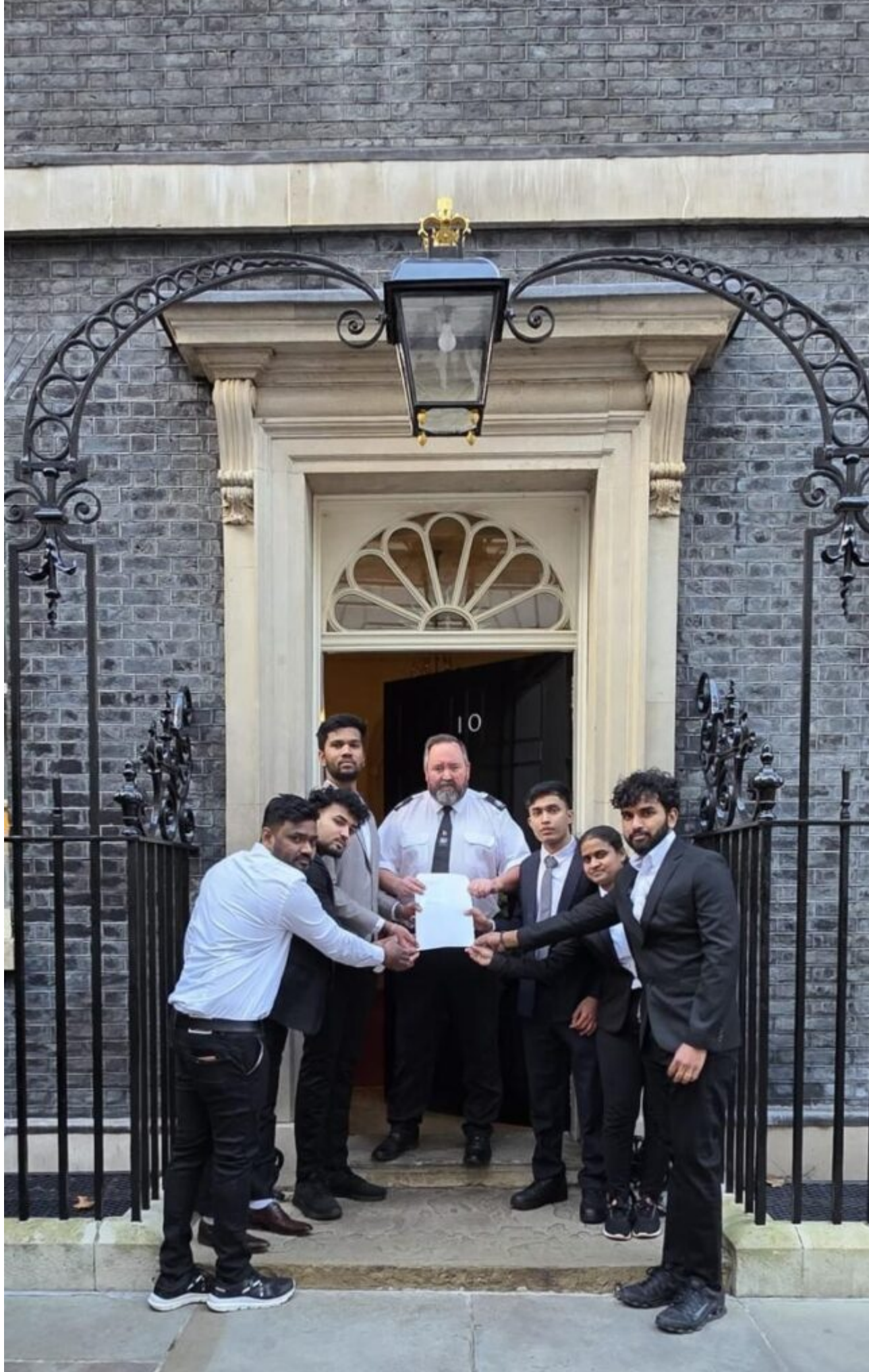
மாவீரர் நாள் மற்றும் சர்வதேச மனித உரிமை தினத்தை முன்னிட்டு, தமிழர்கள் மீது இலங்கை அரசு மேற்கொண்ட இனப்படுகொலை மற்றும் மனித உரிமை மீறல்களுக்கு நீதி கோரி பிரித்தானியப் பிரதமர் கீர்ஸ்டார்மருக்கு இன்று மனு ஒன்று கையளிக்கப்பட்டது . இந்த மனு தமிழினப்படுகொலையை உத்தியோகபூர்வமாக