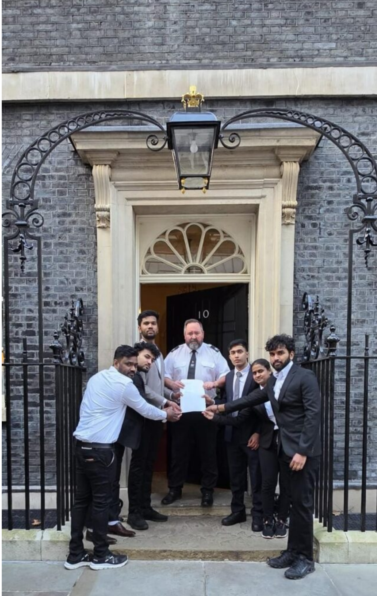
Marking Tamil National Heroes' Day and International Human Rights Day, a petition was today submitted to the British Prime Minister, Sir Keir Starmer, calling for justice for the genocide and grave human rights violations committed against the Tamil people by the Sri Lankan state.