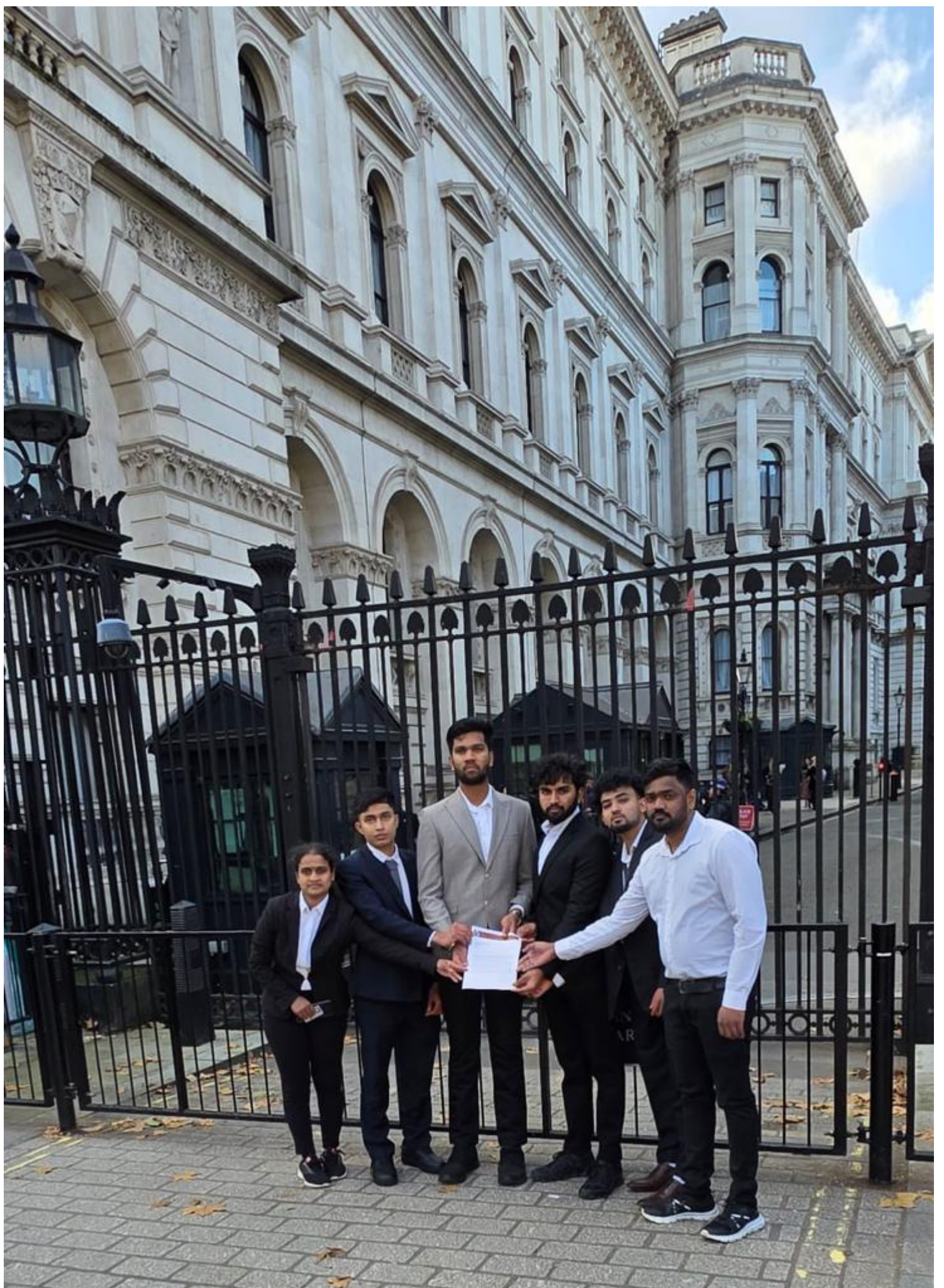
மனுவின் முக்கிய கோரிக்கைகள் பின்வருமாறு: