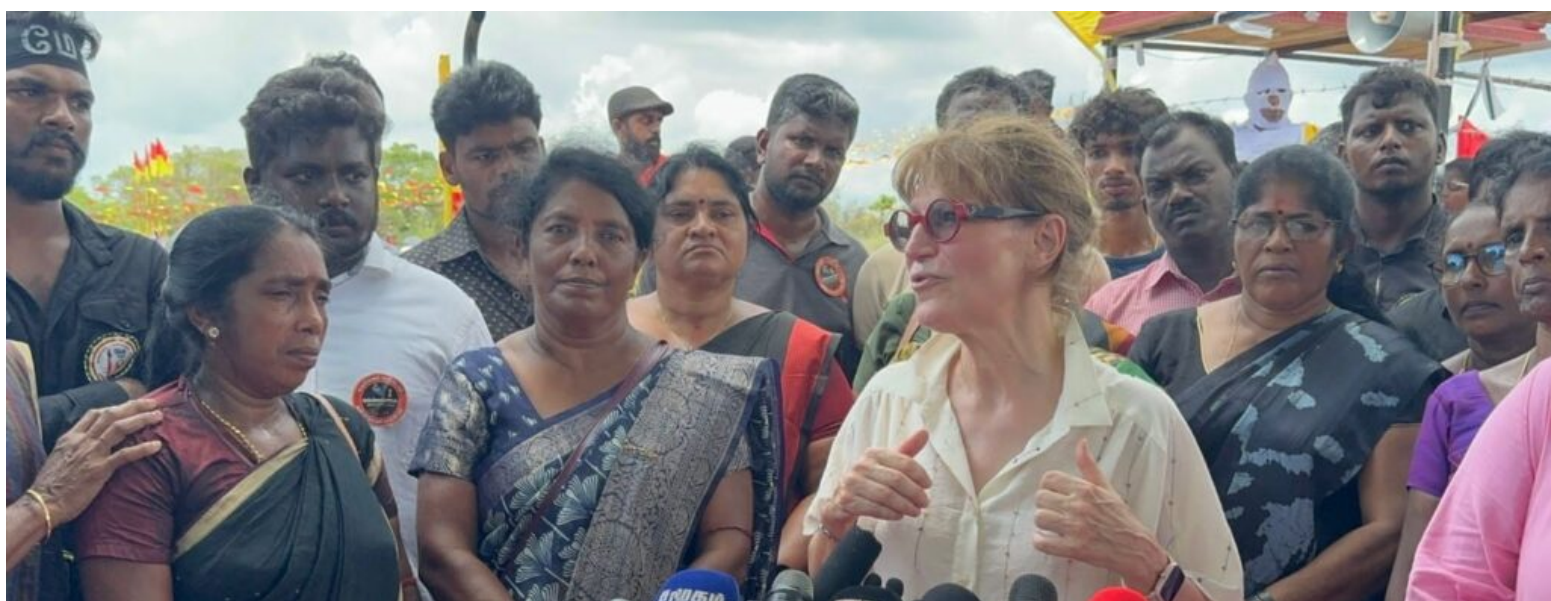
சர்வதேச மன்னிப்பு சபையின் பொதுச்செயலாளர் Dr.Agnès.Callamard முள்ளிவாய்காலில் அஞ்சலி செலுத்தினார்.