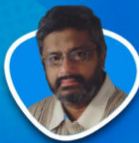
Viraj Mendis Human rights activist Prominent advocate for Tamil rights