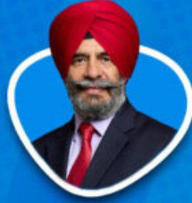
Hon. Jas Athwal MP Member of Parliament for Ilford South