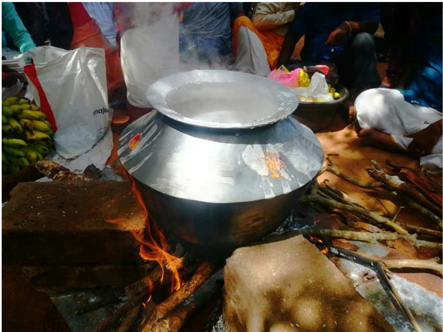
சிங்கள பேரினவாதத்தின் தடைகள் மற்றும் அச்சுத்தல்களை தாண்டி குருந்தூர்மலை ஆதிசிவன் ஐயனார்