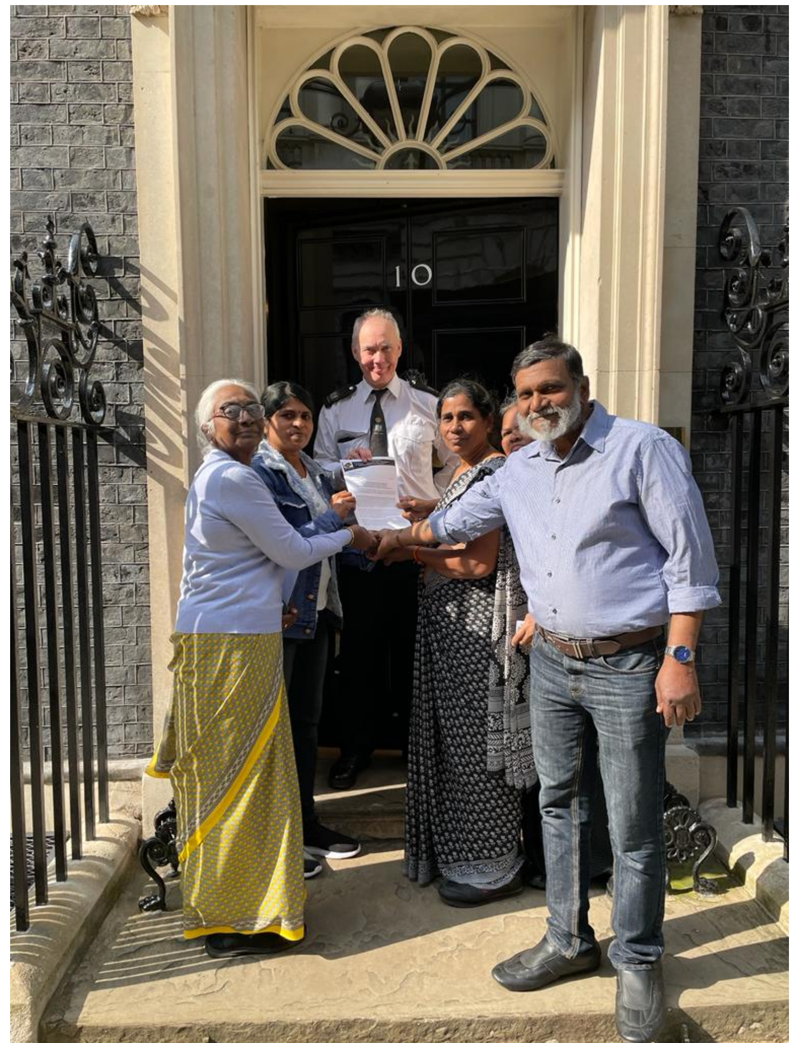
முள்ளிவாய்க்கால் நினைவு நாளில் வடக்கு, கிழக்கில் வலிந்துகாணாமல் ஆக்கப்பட்ட உறவுகளின் சார்பில் பிரித்தானிய பிரதமருக்கு மனு ஒன்று இன்றுகையளிக்கப்பட்டது