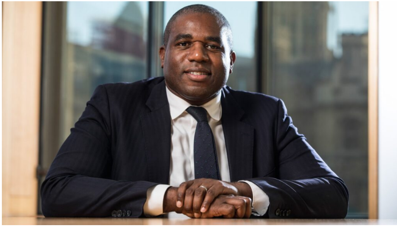
டேவிட் லமி எம்பி (Rt.Hon. David Lammy MP)யுடன் இராஜதந்திர சந்திப்பு –

????????? ?????????????? ?????????????? ????????????????????? ?????????????????????????????????? ?????????? ????????????????? ??????????!