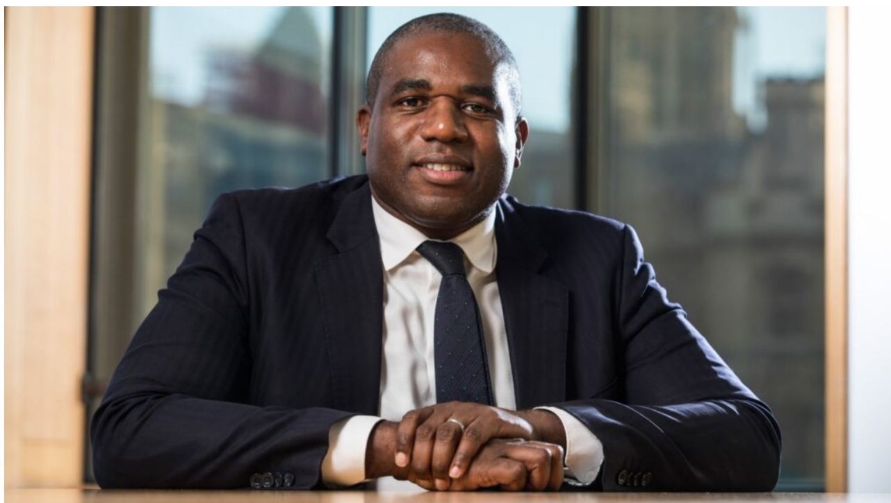
டேவிட் லமி எம்பி (Rt.Hon. David Lammy MP)யுடன் இராஜதந்திர சந்திப்பு –