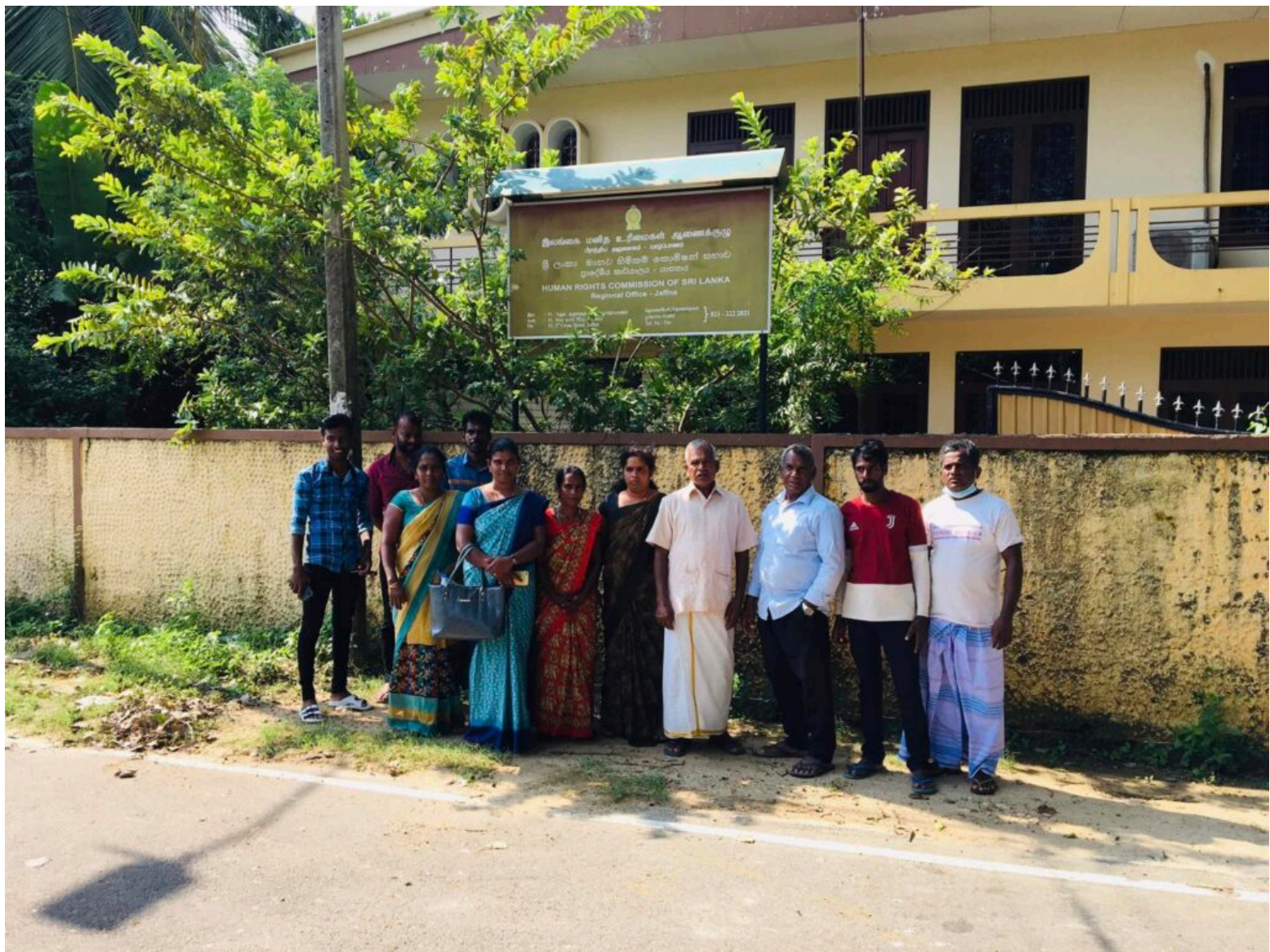
கிராஞ்சி இலவங்குடா கடலில் அண்மைக்காலமாக அமைக்கப்பட்டுவரும் கடல் அட்டைப்பண்ணைகள்