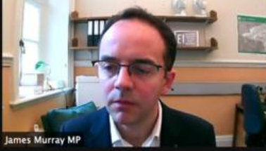
James Murray MP