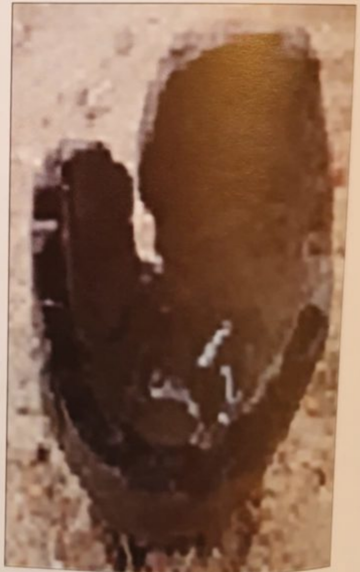
Amphora Jars with tapering bases belonging to the Greco-Roman wine trade 300 BCE-300 CE.