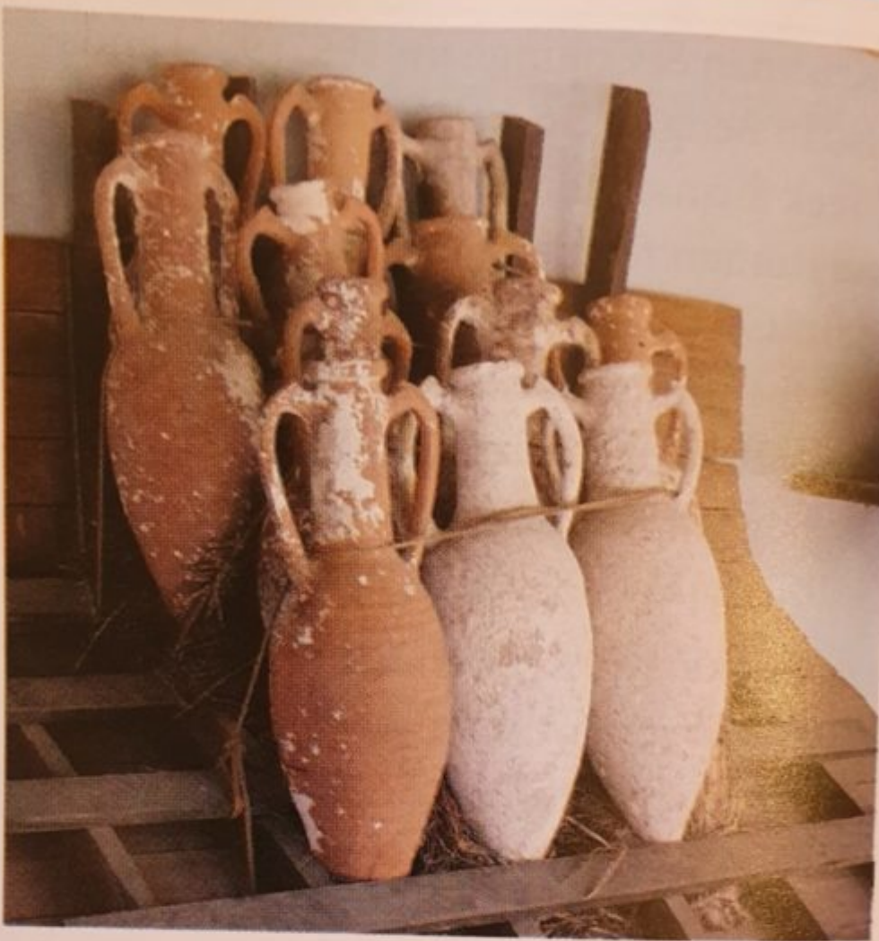
Greek Amphora jars with long necks datable to 600 BCE, used to transport wine, recovered from a shipwreck.