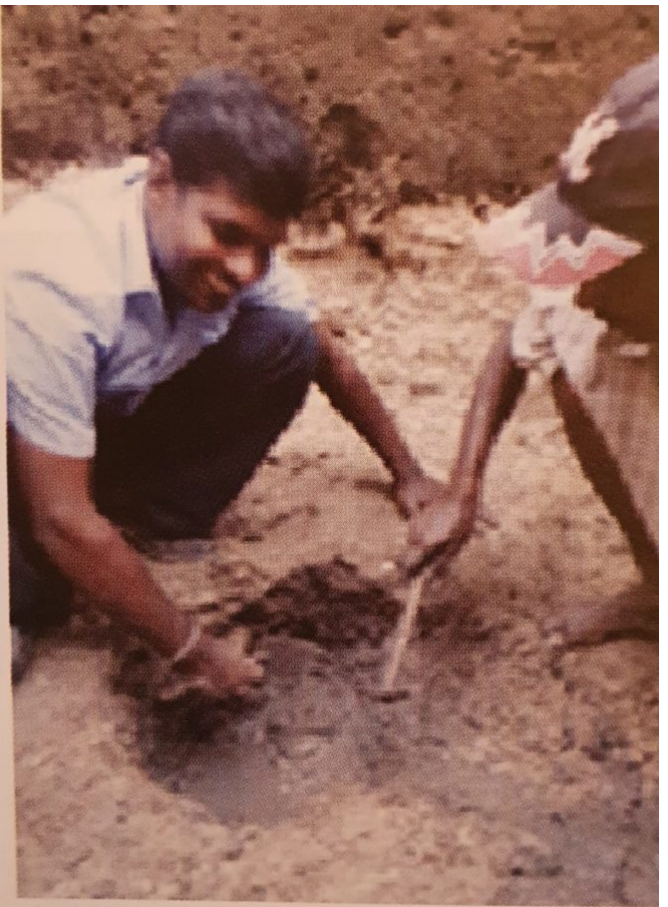
Excavators within the Jaffna Fort in 2011 reaching the water table.

இதன் பின்னர் 01.7.2017-27.07.2018 மீண்டும் ஒரு ஆய்வு கொன்னிங்காம் அவர்களினால் மேற்கொள்ளப்பட்டது. இவ் அகழ்வாய்வில் கிடைத்த கருப்பு -சிவப்பு மட்பாண்டம் யாழ் கோட்டை பெருங்கற்கால