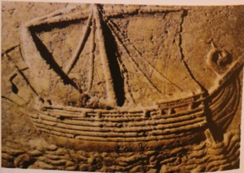
Wood carving of a Phoenician ship