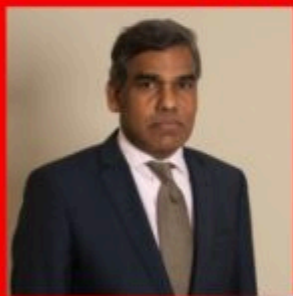
Sen Kandiah Chair