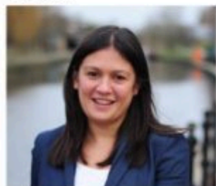
Lisa Nandy MP Shadow Secretary of State for Foreign and Commonwealth Affairs