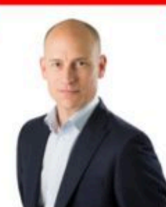
Stephen Kinnock MP Shadow Minister for Asia and Pacific