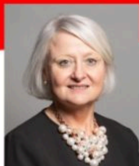
Siobhain McDonagh MP Vice Chair APPG for Tamils