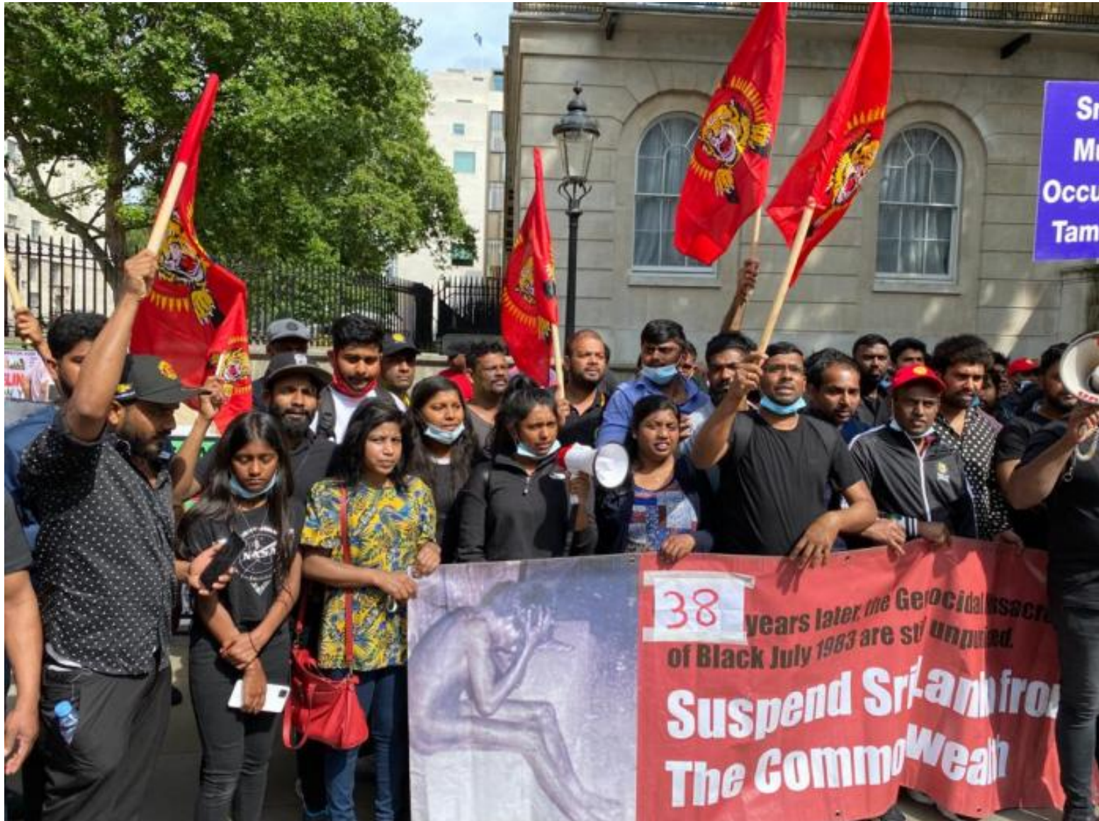
தமிழர்களுக்கு எதிரான சிங்களன பேரினவாதத்தின் திட்டமிட்ட இன அழிப்புக்களில் ஒன்றான கறுப்பு