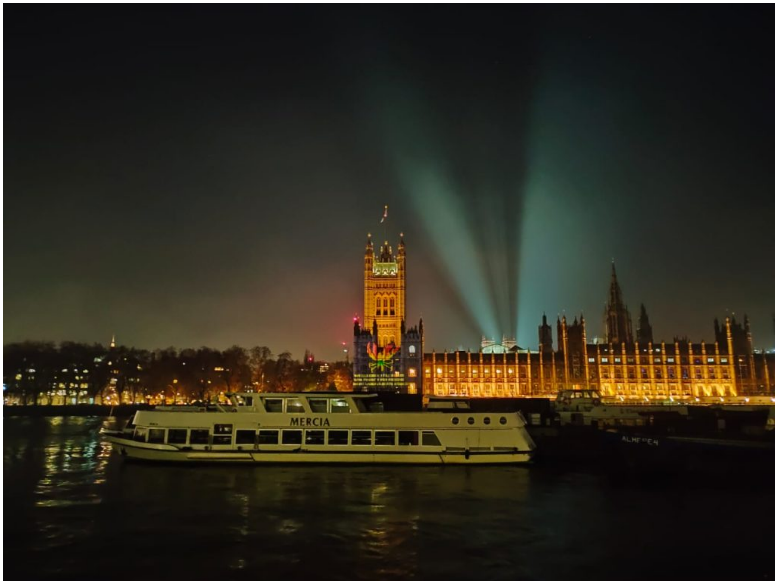
மாவீரர் நினைவு நாளினை முன்னிட்டு பிரித்தானியாவின் பாராளுமன்ற கட்டடத்தொகுதியில் லேசர் கதிர்