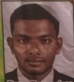
Prasa Enterprises Lanka Pvt (Ltd)