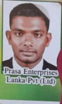
Prasa Enterprises Lanka Pvt (Ltd)