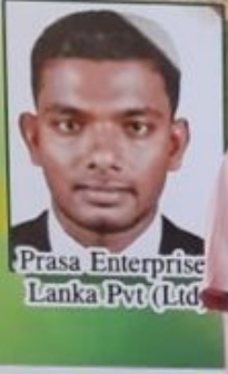
Prasa Enterprise Lanka Pvt (Ltd)