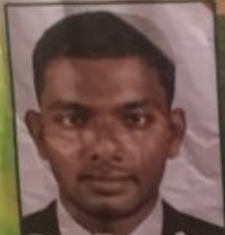
Prasa Enterprises Lanka Pvt (Ltd)