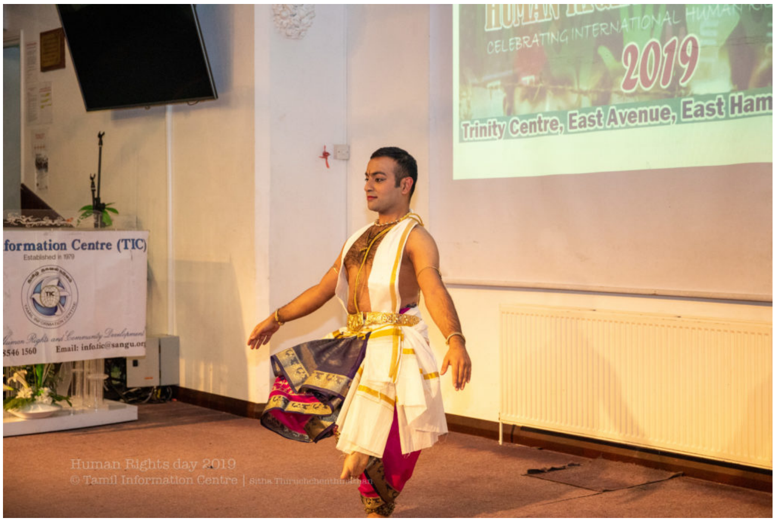
Human Rights day 2019