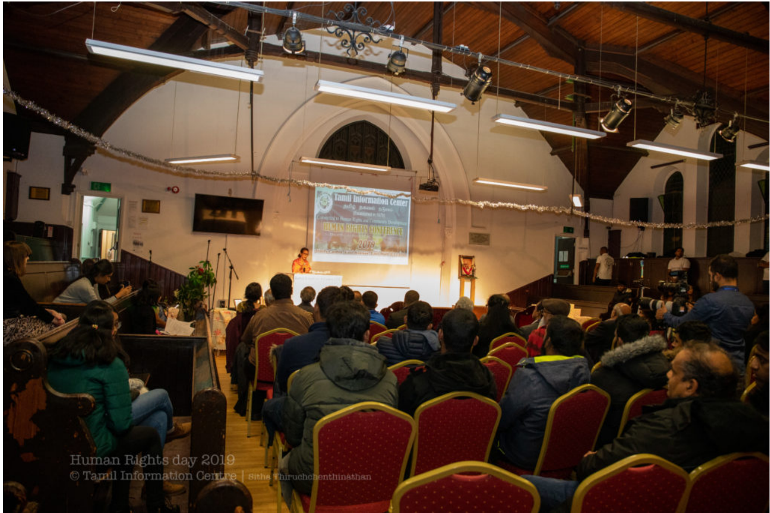
Human Rights day 2019