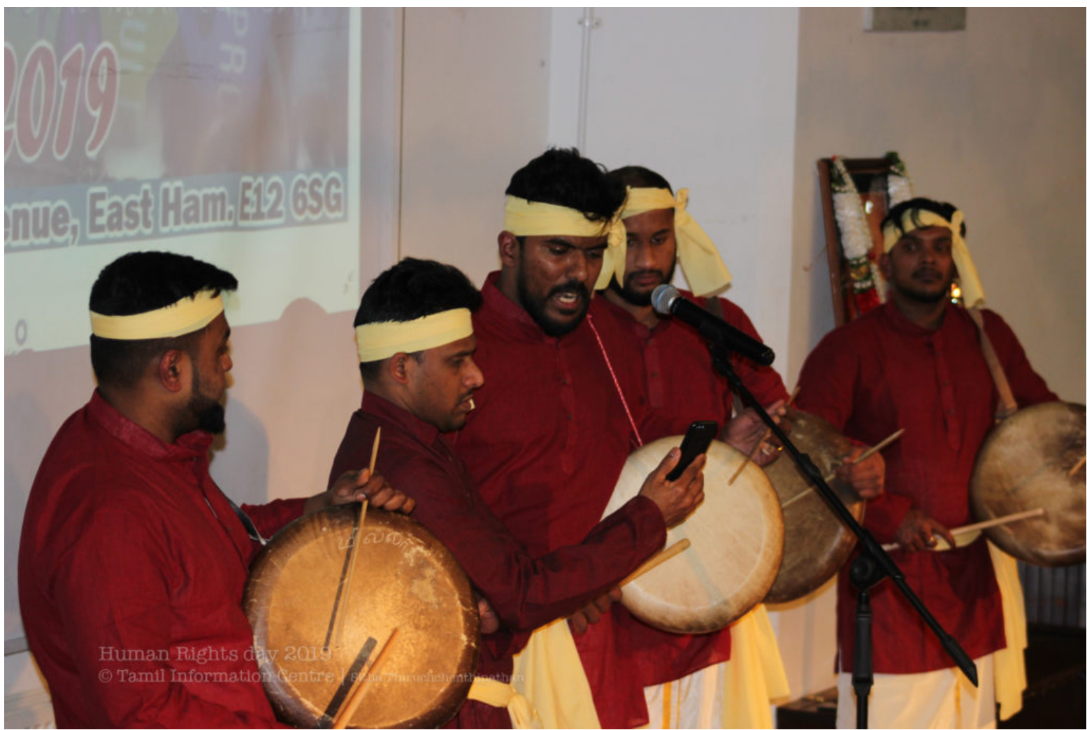
Human Rights day 2019