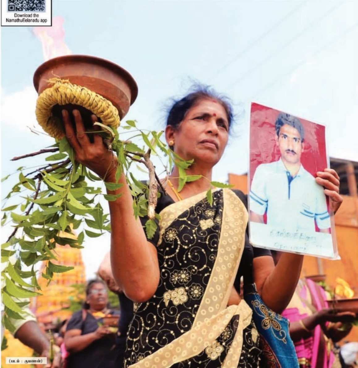
(ம.ந. : குணசேகரன்)